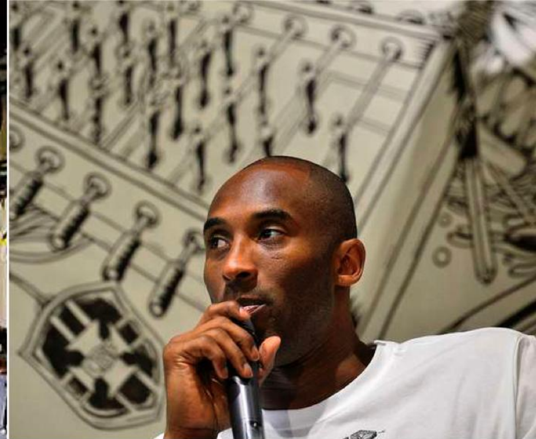
Kobe Bryant surrounded by journalists with Bormaister's art as backdrop.