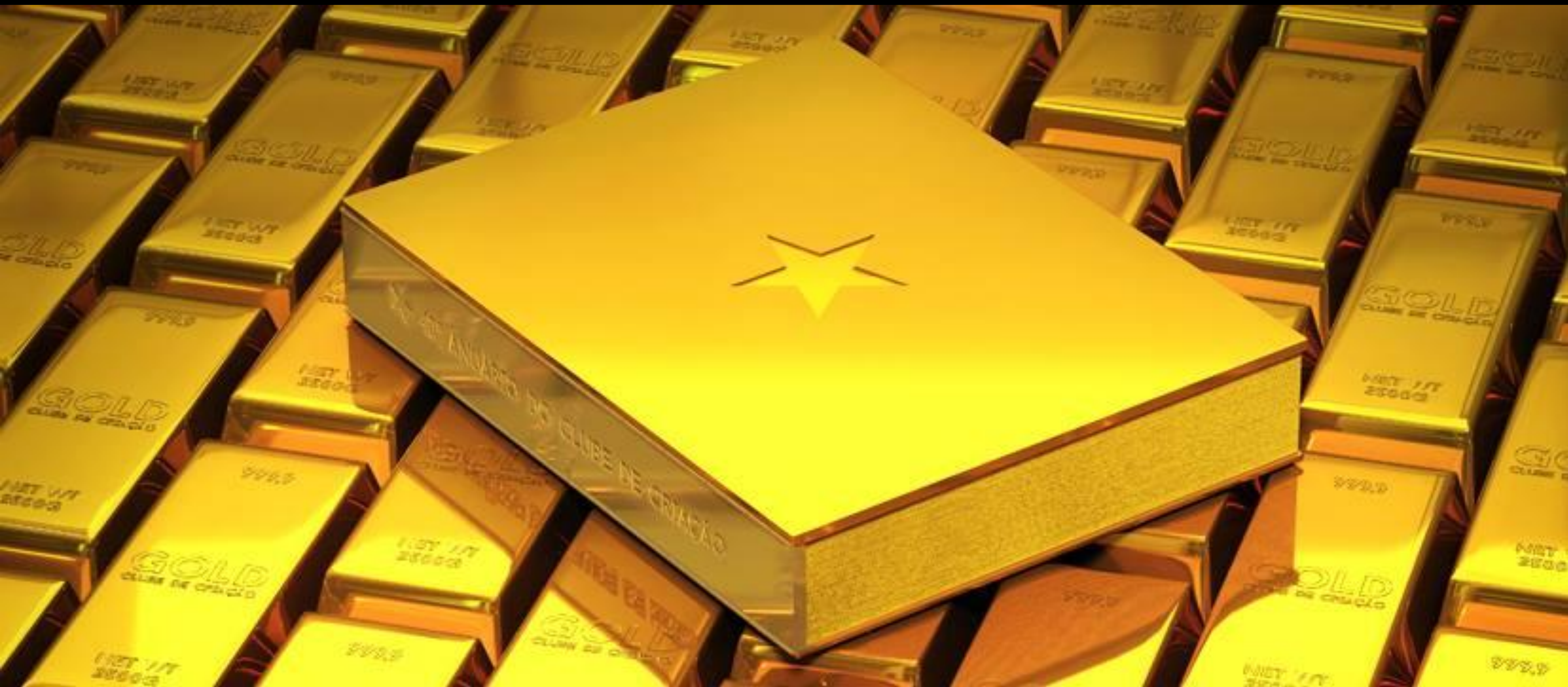
Imagem: Clube de Criação