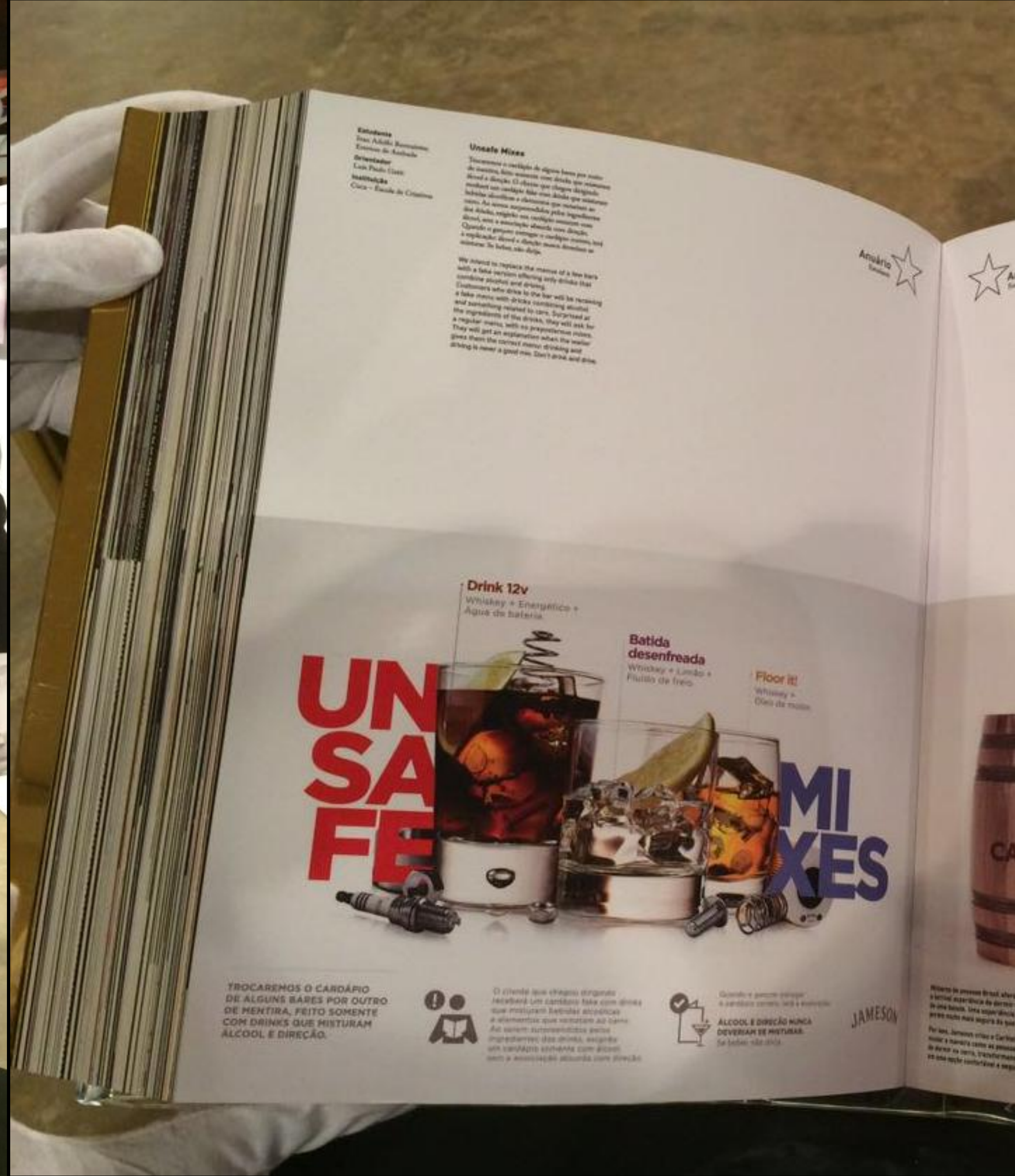
Imagem: Ivan Bormaister